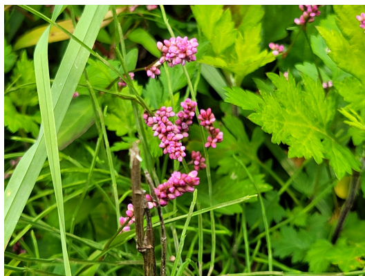
털여뀌 [ Persicaria orientalis (L.) Spach]