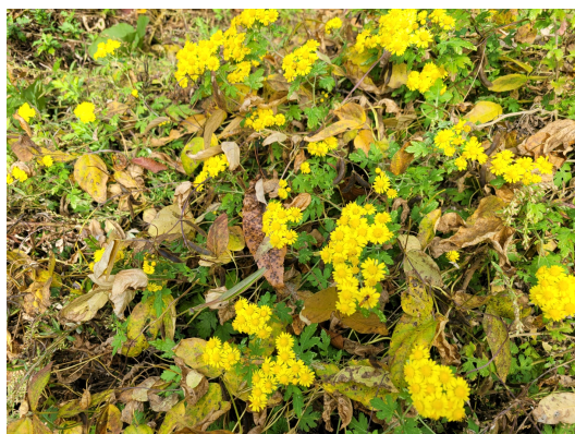
산국 [ Dendranthema boreale (Makino) Ling ex Kitam.]